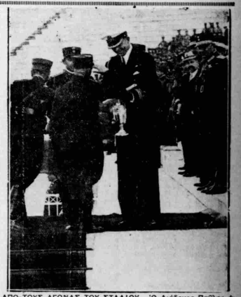
ΑΠΟ-ΤΟΥΣ ΑΓΩΝΑΣ ΤΟΥ ΣΤΑΔΙΟΥ. Ο Διάδοχος Παύλος άνατοκιστή του τρυφερό του ήμισους, κάταρση ά άνατοκιστή του τρυφερό του ήμισους...