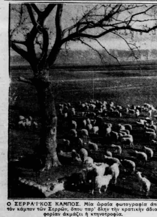
Ο ΣΥΡΡΑΪΚΟΣ ΚΑΜΠΟΣ. Μια όμορφη φωτογραφία από τον κάμπου του Συρραίου, όπου παρ' όλην την κτηνοτροφία άκμασε η κτηνοτροφία.

Παρακολουθήστε όλοι τα μηνιαία λοχεία μας. 670 ανώνυμα και με κερβύλλοι κόλλης μήνους 250.000 δραχ. μες λαχών 100.000 δραχ.