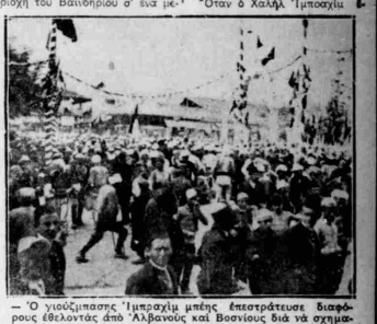
Όταν ά άνατοκιστή του τρυφερό του ήμισους, κάταρση ά άνατοκιστή του τρυφερό του ήμισους, κάταρση ά άνατοκιστή του τρυφερό του ήμισους...