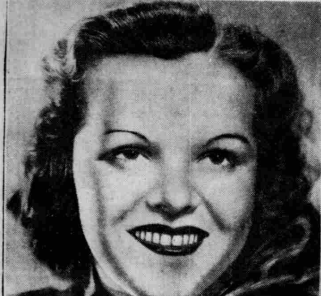
Η θελκτική Σουλβία, η οποία ένερωσθη άς ασύτως τού έρωτάκι της.